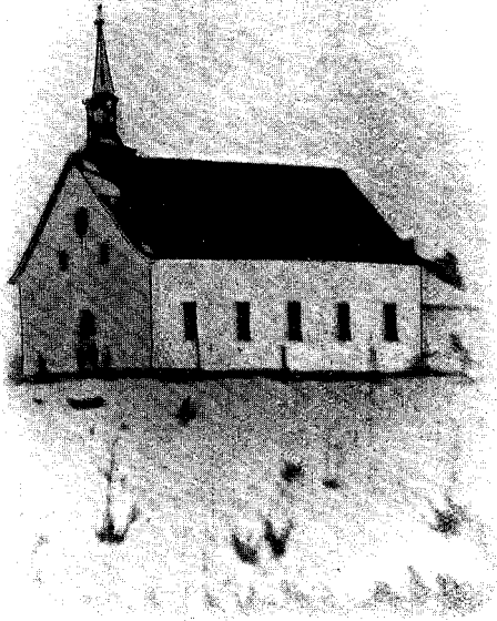
PREMIÈRE EGLISE DE SAINT-LOUIS 1835.